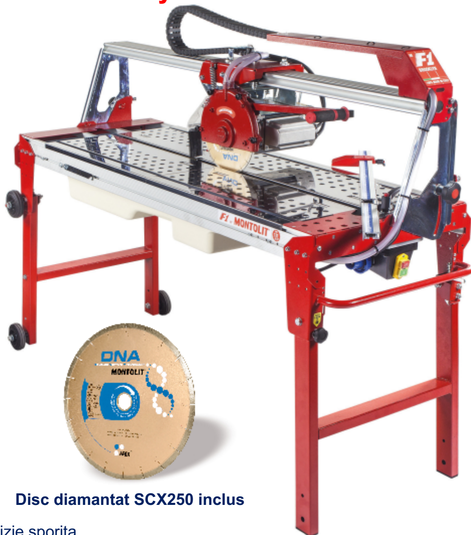
Disc diamantat SCX250 inclus