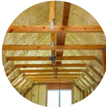
Mansarde / Poduri