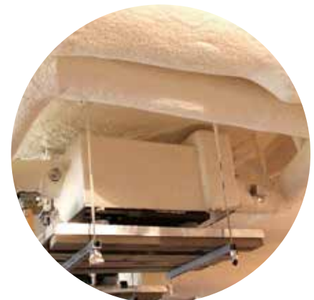
Canale pentru tubulaturi HVAC