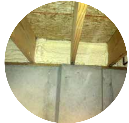
Podele / Pardoseli