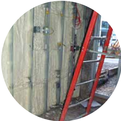
Cavități din pereți / Goluri

* Pentru detalii consultați specificațiile producătorului de produse chimice.