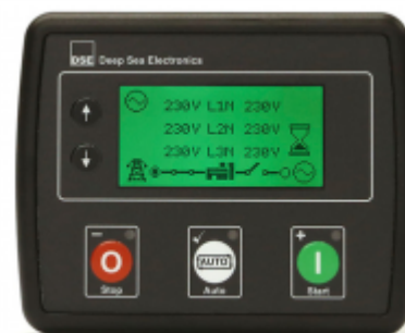
Panou comanda tip QT2A-4520

Protectie IP 65 Temperatura de lucru -30° + 70°C