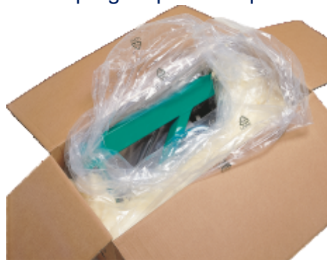
Mod ambalare si transport

Echipare de serie: Comanda la distanta prin cablu Dispozitiv de siguranta Reducator in baie de ulei Motor electric clasa S3 Cadru pregatit pentru suport ancorare