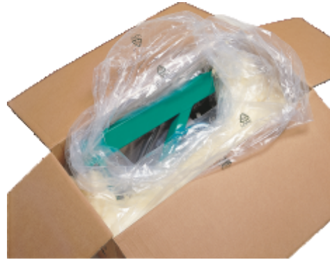
Mod ambalare si transport