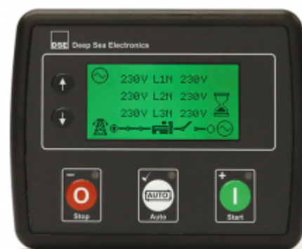
Panou comanda tip QT2A-4520

Protectie IP 65 Temperatura de lucru -30° + 70°C