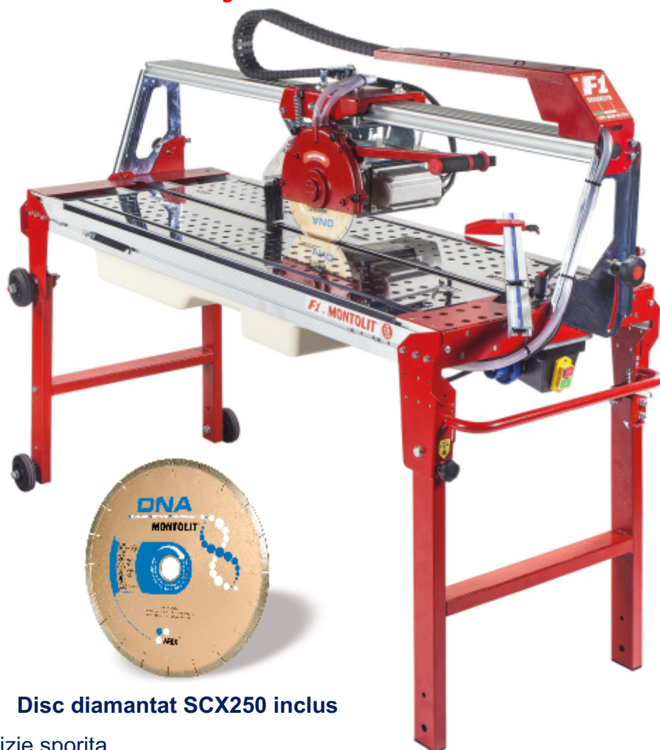
Disc diamantat SCX250 inclus