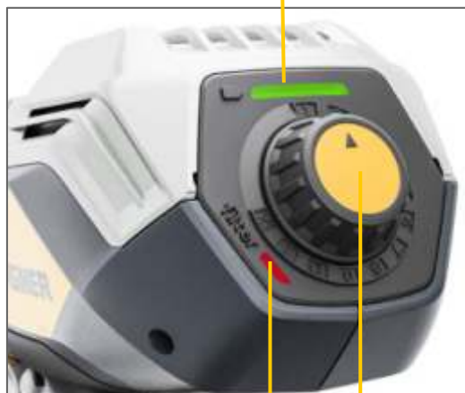
Bec de avertizare filtru de aer