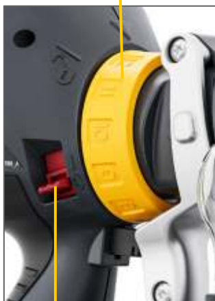
Protecție întrerupător și declanșare