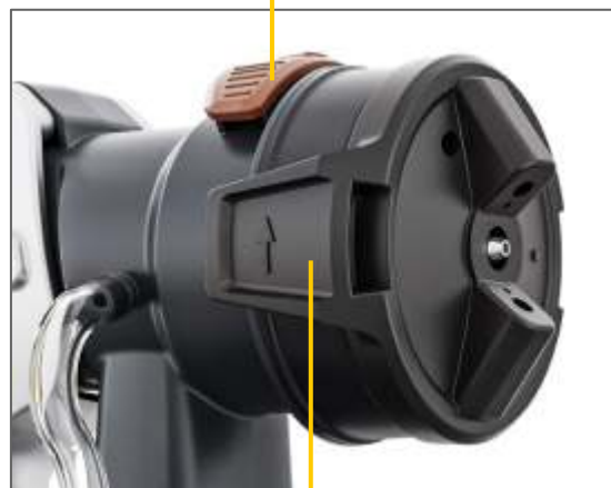
Jet spray orizontal / vertical