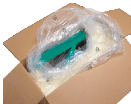
Mod ambalare si transport