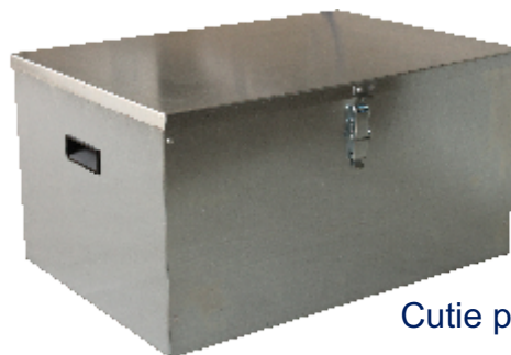
Cutie pentru transport