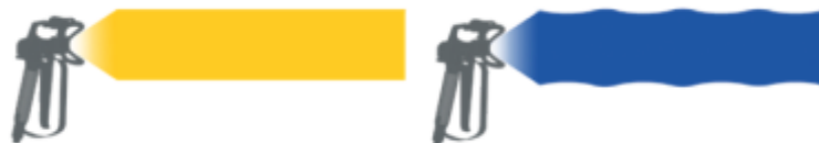
Fig.: La presiune scazuta: